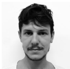
dier, vous remer-