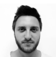
Maxime cient pour