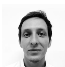
Sauce et Pierre ce stage très

Consulter le dossier en ligne : http://issuu.com/maximesauce/docs/dossier_final_smd_140815